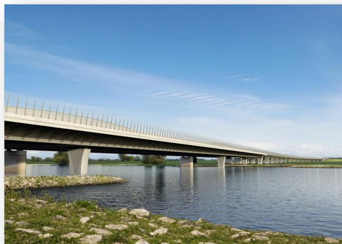
Visualisierung der geplanten Elbequerung bei Wittenberge

Nach einer Einführung und einer Sicherheitsbelehrung durch SiGeko, fahren wir mit unseren PKWs zur Besichtigung der Baustelle A14 - Elbequerung.