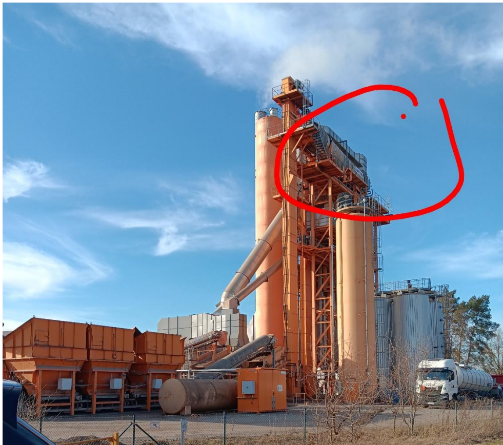
Mischanlage Gardelegen mit obenliegender Mischtrommel

Nach der Besichtigung der Mischanlage treten wir die Heimreise an.